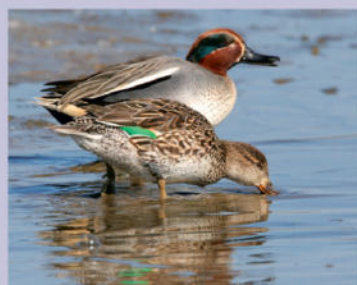
Krickente