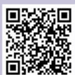
zum NZ auf Instagram