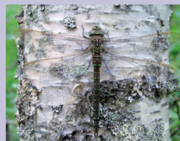
Torf-Mosaikjungfer | M. Olthoff