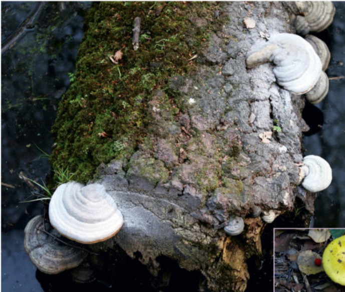
Zunderschwamm und Gelber Graustieläubling | K. Wittjen