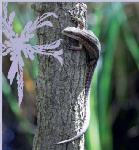
Waldeidechse | M. Beiring