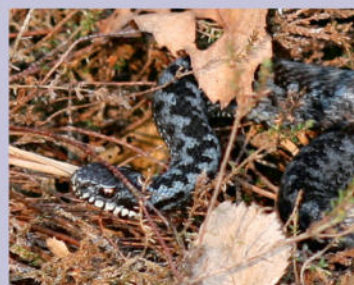
Kreuzotter | K. Wittjen