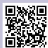
zum NZ Website

Landesbetrieb Wald und Holz NRW Regionalforstamt Münsterland Albrecht-Thaer-Straße 22 48147 Münster Tel.: 0251 - 91797-440 Fax: 0251 - 91797-470 www.wald-und-holz.nrw.de muensterland@wald-und-holz.nrw.de