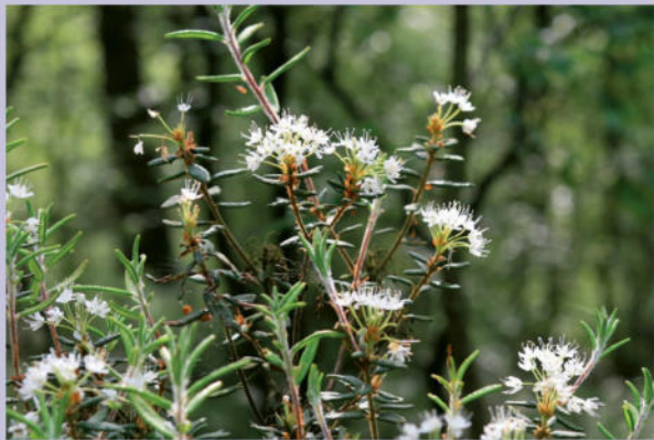
Der Grönländische Porst; Einzigartiges Relikt der Eiszeit oder als botanische Rarität ausgewildert? Ein bisher ungelöstes Rätsel des Venner Moores.

Das Venner Moor umfasst eine Fläche von rund 148 Hektar und liegt in der Gemeinde Senden (Kreis Coesfeld), 12 km südwestlich der Stadt Münster. Es gehört zu den wissenschaftlich am besten untersuchten Hochmoorgebieten des Münsterlandes.