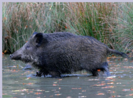
Wildschwein | R. Breidenbach